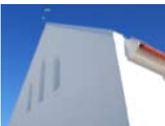
S:ta Katarina kyrka Långsättersvägen 1, Arnö

På Spa för själen kl. 15.00-19.30 och heldagsretreaten erbjuds du: